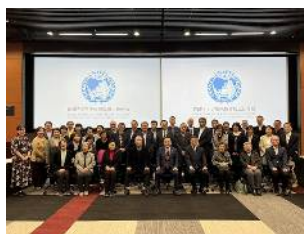
UNAFEI 研修室での集合写真