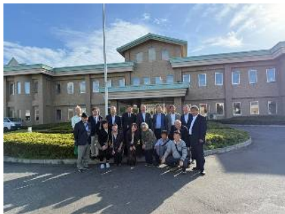
函館少年刑務所正面玄関での集合写真

10月6日午後、函館少年刑務所に17名で伺ってきました。天候が心配されましたが当日は晴天にも恵まれました。函館少年刑務所は総合訓練施設の指定を受け、被収容者の生活基盤確立の為、木工、洋裁、農業、自動車の洗車、車検整備など11種目の職業訓練を実施されています。船舶職員訓練は全国から希望者があるそうです。刑務所の歴史や現状、特色などお話を伺って施設見学をいたしました。その後質疑応答がありました。研修を終えて「大変勉強になりました。驚くことばかりでした」「所内は静かで明るく職員の方のご努力を感じました」「職業人として円滑な社会復帰ができるように忍耐力、自立心を培わせている事がわかりました」との感想が寄せられ充実した1日を過ごすことができました。移動中や夕食時には分区の方々との交流、情報交換や先輩からのアドバイスもいただき貴重な時間でした。途中では美味しい牛乳やソフトクリームもいただきみなさんの笑顔が見られました。これも準備、企画をしてくださいました、研修部のみなさまのお陰と感謝しています。今回参加できなかった皆様もぜひ次回は参加していただけますことを希望します。